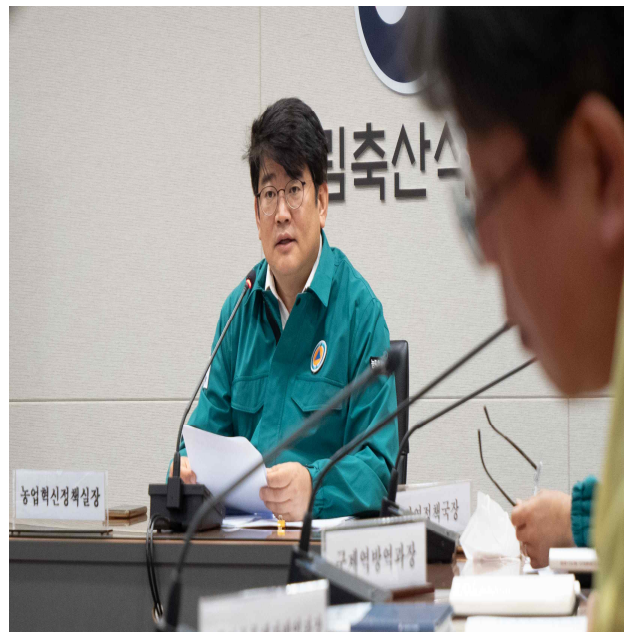
중수본 회의 장면