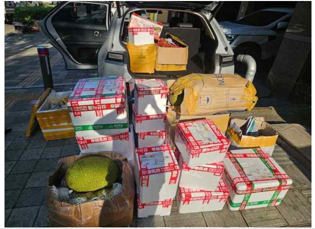
적발 생과실(롱간 등)