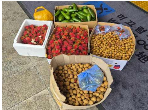
적발된 생과실(람부탄 등)