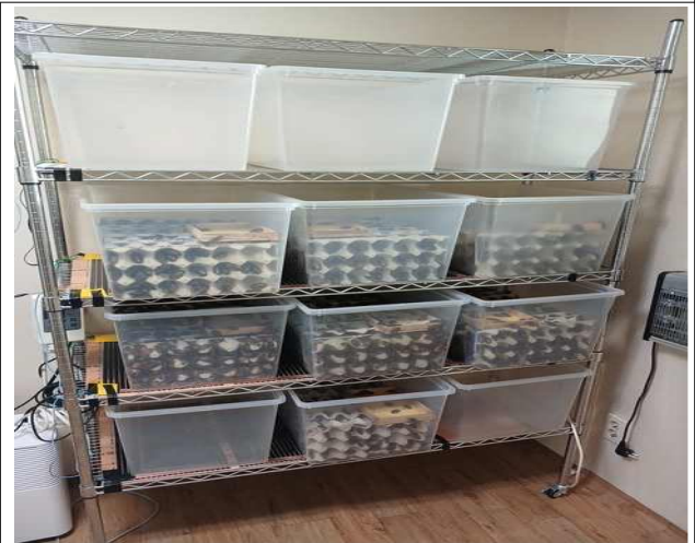
불법 수입·유통된 외국 곤충(두비아로치)