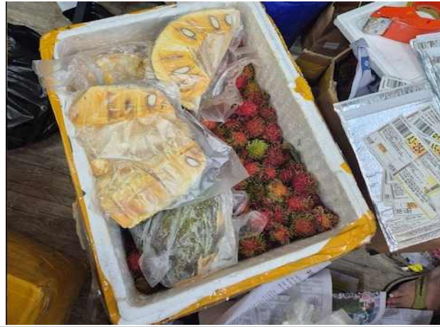
적발된 생과실(람부탄, 두리안)