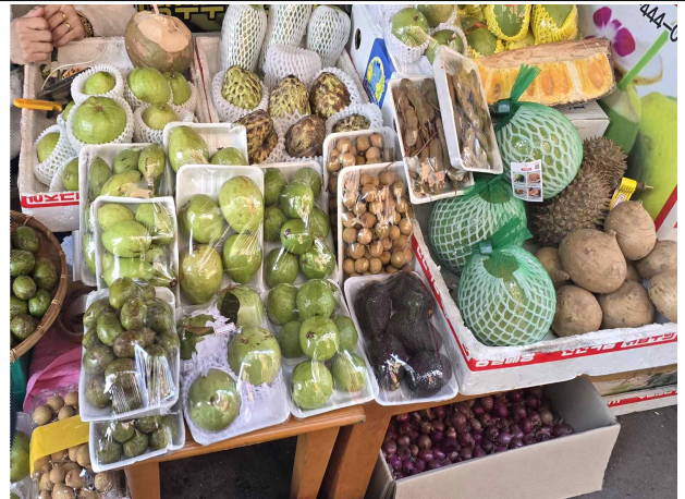
적발된 생과실(슈가애플 등)