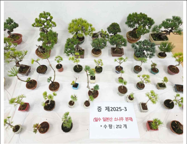
불법 수입·유통된 일본산 소나무분재류